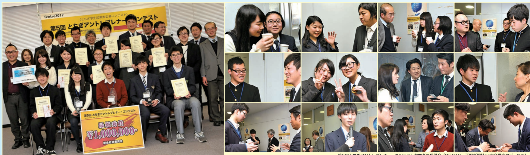
第5回とちぎアントレプレナー・コンテスト参加者の懇親会(2月24日、下野新聞社5F大会議室ロビーにて)